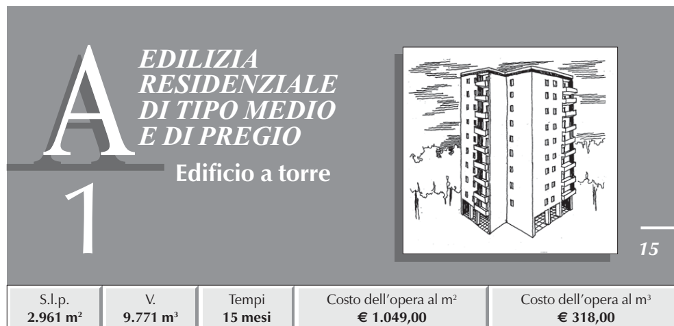
TABELLA RIASSUNTIVA DEI COSTI E PERCENTUALI D'INCIDENZA