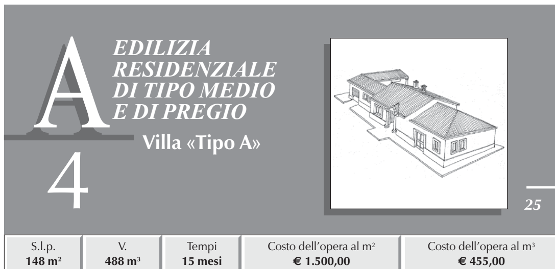
TABELLA RIASSUNTIVA DEI COSTI E PERCENTUALI D'INCIDENZA